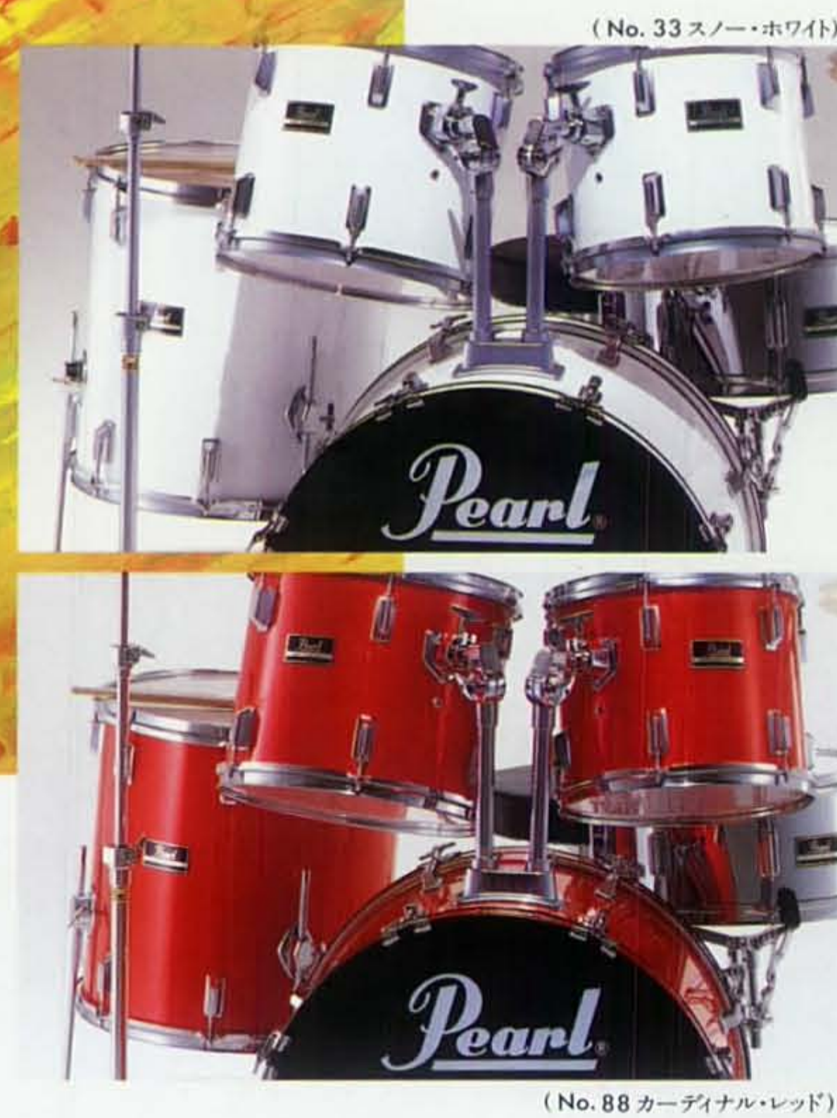
(No. 33 スノー・ホワイト)