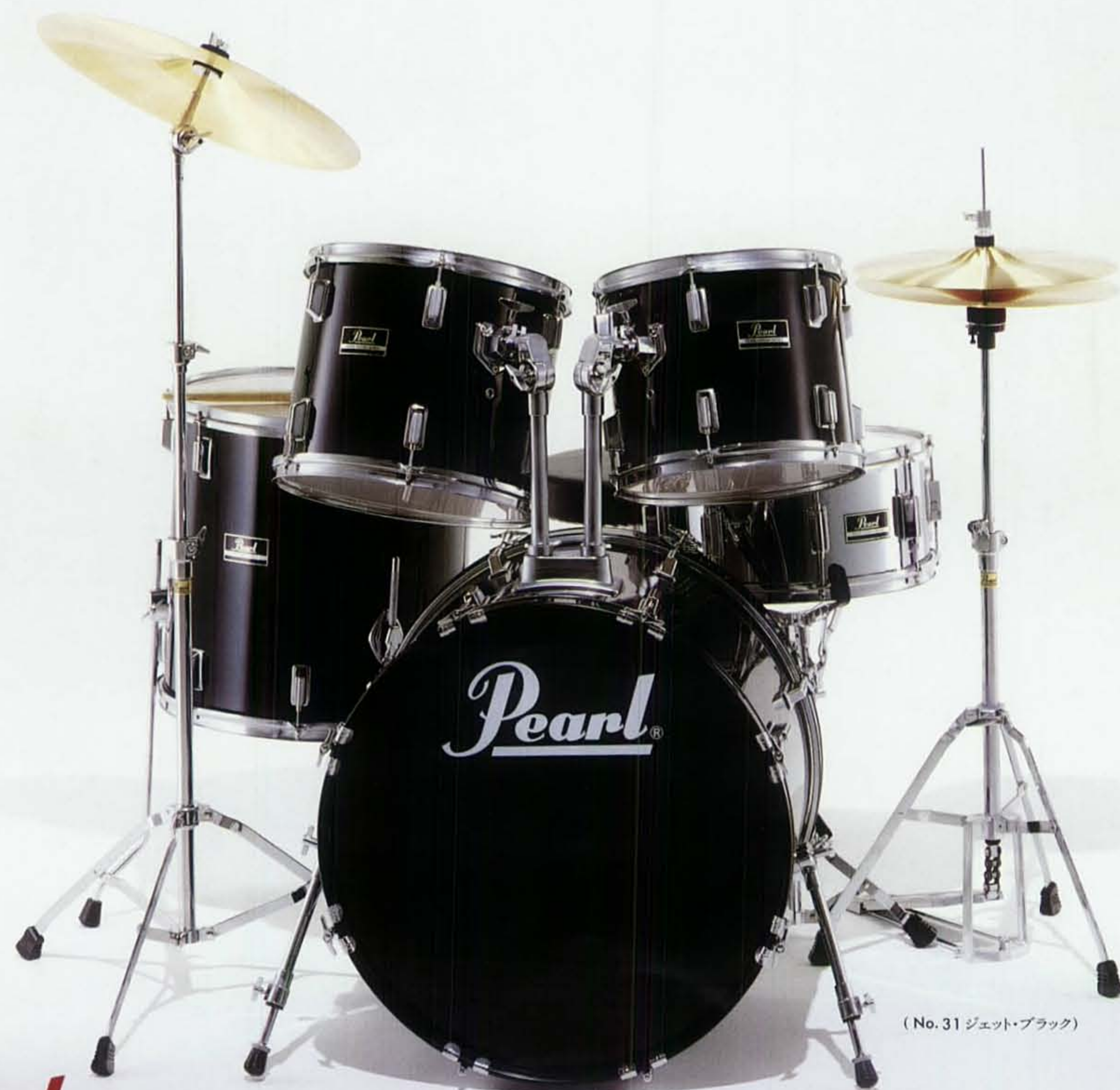
(No. 31 ジェット・ブラック)